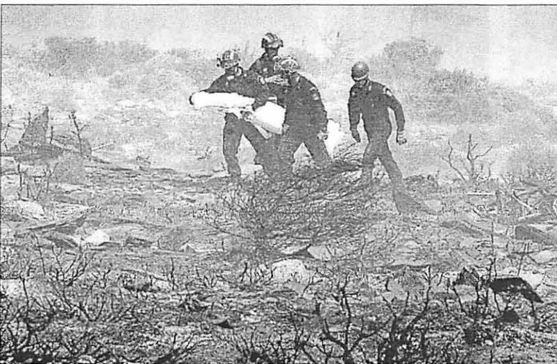
Redningspersoner hadde en tung oppgave med å bringe forkullede lik ut av området der flyet traff bakken i fjellene nær Grammatikas, ca 45 km nord for Aten. (NTB/AFP)

uavbrutt om ulykken, som hadde tatt 121 menneskeliv i Nikosia raket det imidlertid fullstendig. Informasjonskansk, melder Der Spiegel. Syv timer etter var Landets samferdselsminister ikke i stand til å si noe tydelig hvem som var om bord. – De var nesten alle kypriotere, var det eneste han kunne meddele. Flyselskapet Helios kunne lenge bare opplyse et navn, og ikke fornavn på de omkomne.