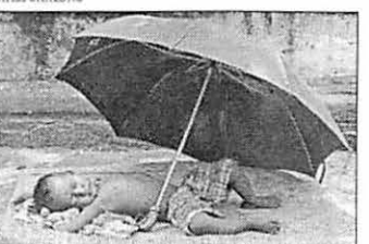
India feirer all 58. år med uavhengighet fra Storbritannia i dag. Fortsatt lever rundt 30 prosent av befolkningen under fattigdomsgrensen, som dette hjemløse barnet i Calcutta.