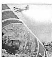
Video bildet viser halepartiet på det styrtede Boeing 737-flyet fra Helios Airways.